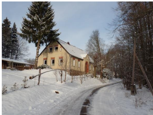
Fot. 3 Dawna szkoła w Taszowie.

murowana konstrukcja. Jednak do ciekawszych należy zaliczyć także dawną szkołę z 1878 roku.