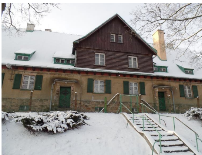
Fot. 2 Budynek Grentzschutzu w Taszowie.

W pobliżu znajduje się dawna placówka Grentzschutzu, służby ochrony pogranicza, później ośrodek wypoczynkowy dla pracowników Akademii Rolniczej we Wrocławiu. Budynek wzniesiono w latach 30. XX w. Jest dość długi, jednokondygnacyjny, nakryty dwuspadowym dachem z odeskowaną facją (odeskowane są również szczyty obiektu). Reprezentuje on tzw. Heimatstil - modernizm z elementami stylu rodzimego.