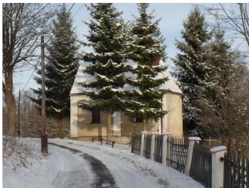
Fot. 1 Kapliczka św. Jadwigi Królowej w Taszowie.

prostokąta, nakryty dwuspadowym dachem z sygnaturką. Obecnie wieżyczka nie istnieje, zaginął także ołtarz (nie wiadomo gdzie się znajduje).